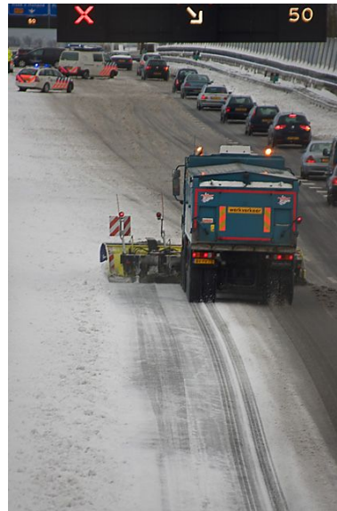
Gladheidsbestrijding (iets te laat)

www.digifotopro.nl/artikel/2327588/dubbele-fotowedstrijd-winter-passie