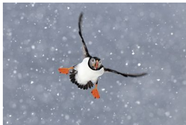
© Jan Vermeer – Puffin in the Snow