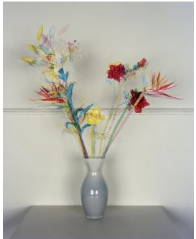
© Jaap Scheeren & Hans Gremmen