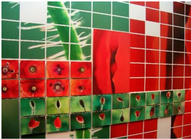
van tentoonstelling Oer