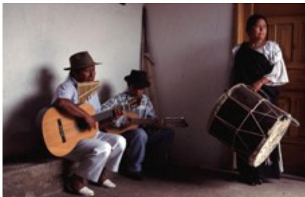
Muzikanten in Ecuador

Wedstrijd die zowel openstaat voor professionele fotografen als voor amateurfotografen. Stuur je mooiste muziekfoto in en maak kans op een van de mooie prijzen. Inzenden kan tot 23 maart 2009. www.fotografie.nl/fotowedstrijd2.php