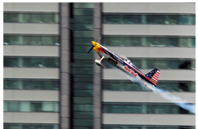
(Red bull Air Race – Jan Noordermeer)

Er was op de avond ook nog vrij werk te zien.