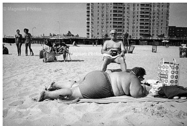
(Coney Island – Bruce Gilden)

De foto's van Bruce Gilden worden gekenmerkt door close-ups vaak met flitslicht. De toeschouwer krijgt hierdoor het gevoel niet naar een foto te kijken, maar deel van de foto te zijn.