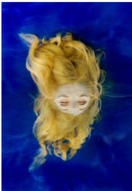
(© Dindi van der Hoek)