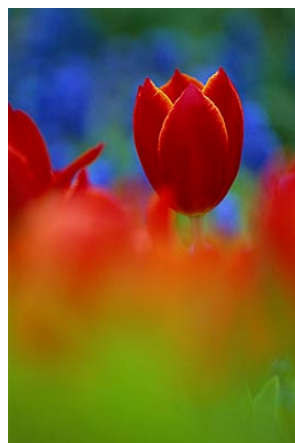
(Tulip – Clive Nichols )

Nu de dagen alweer aan het lengen zijn, komen er ook weer bloemen te voorschijn. Krokussen, narcissen en sneeuwkllokjes zijn er volop, maar ook de magnolia staat alweer bijna in bloei. En een extra voordeel van het fotograferen van bloemen: je hoeft er niet altijd voor naar buiten. Je kunt ze ook binnenhalen, als het weer niet al te best is.